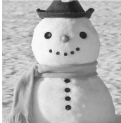
BOULOMIG ERC'H boulomig erc'h