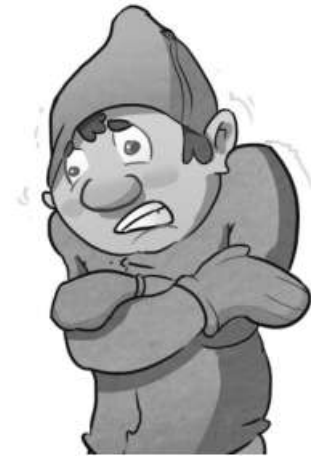
YEN EO DIN yen eo din