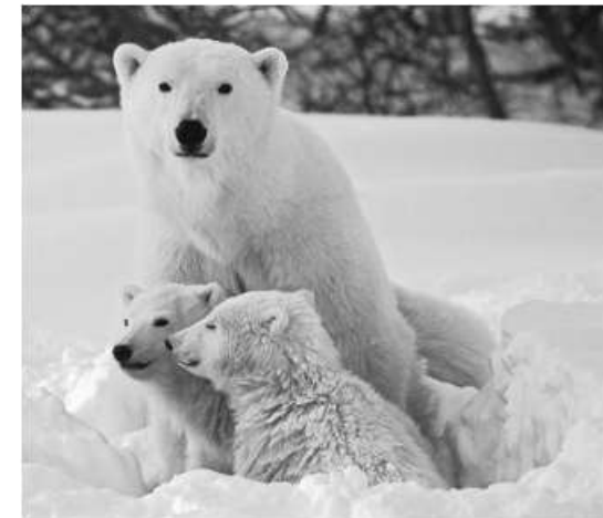
ARZH GWENN arzh gwenn