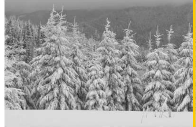
KOAD ERC'HEK koad erc'hek