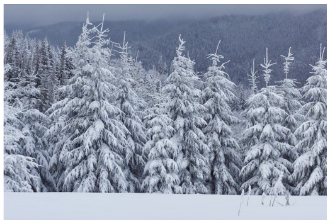
FORÊT ENNEIGEE forêt enneigée