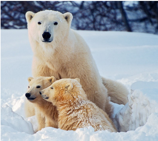
OURS POLAIRE ours polaire