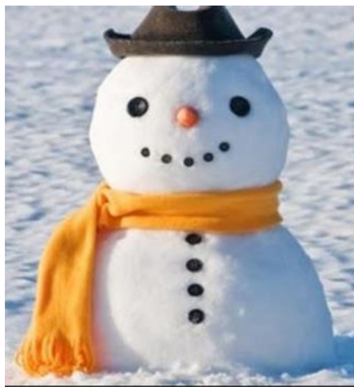
BONHOMME DE NEIGE bonhomme de neige