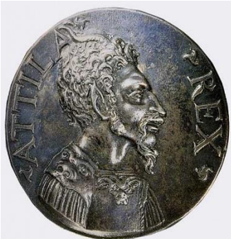
Attila, chef des Huns

D'après Ammien Marcellin, historien, vers 376