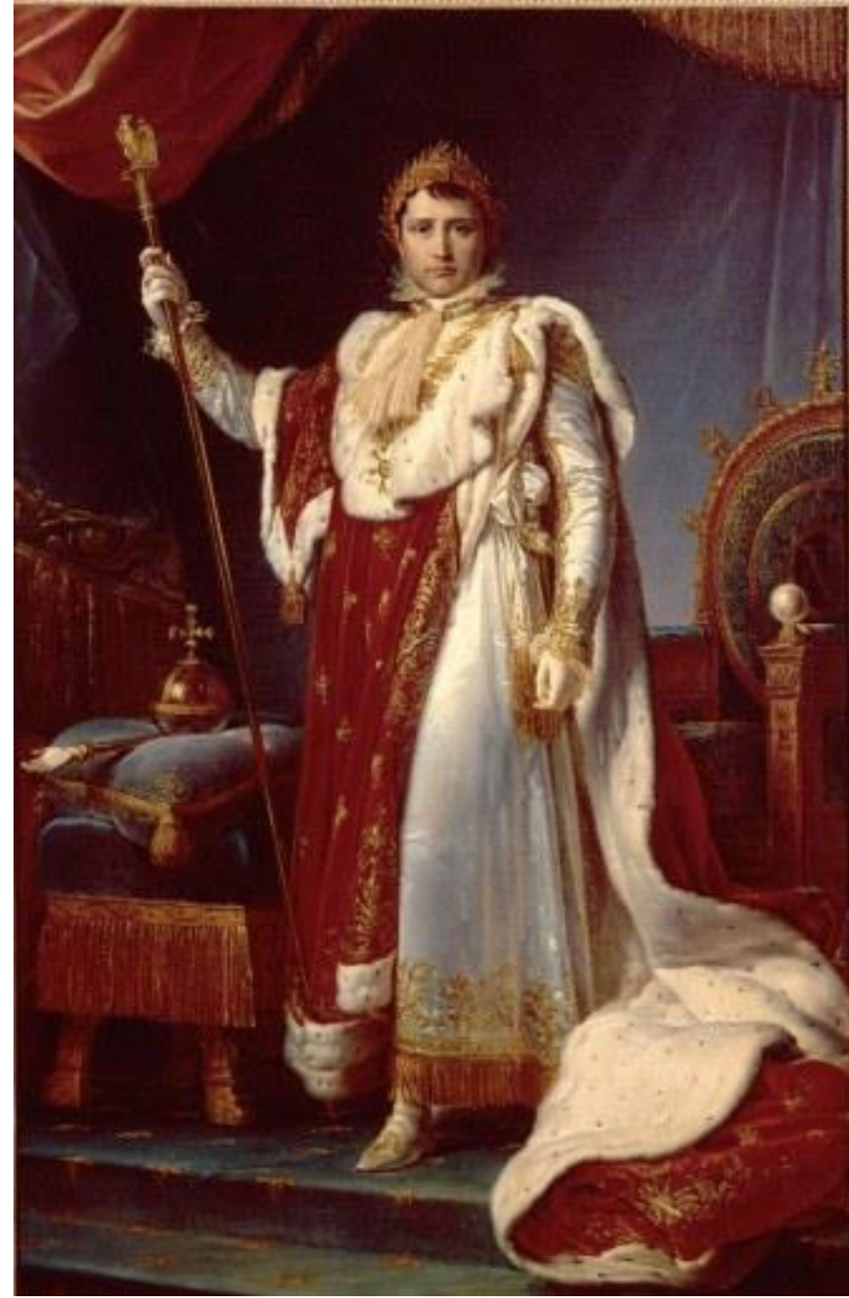
← Napoléon en costume de sacre, Tableau de François GERARD vers 1805