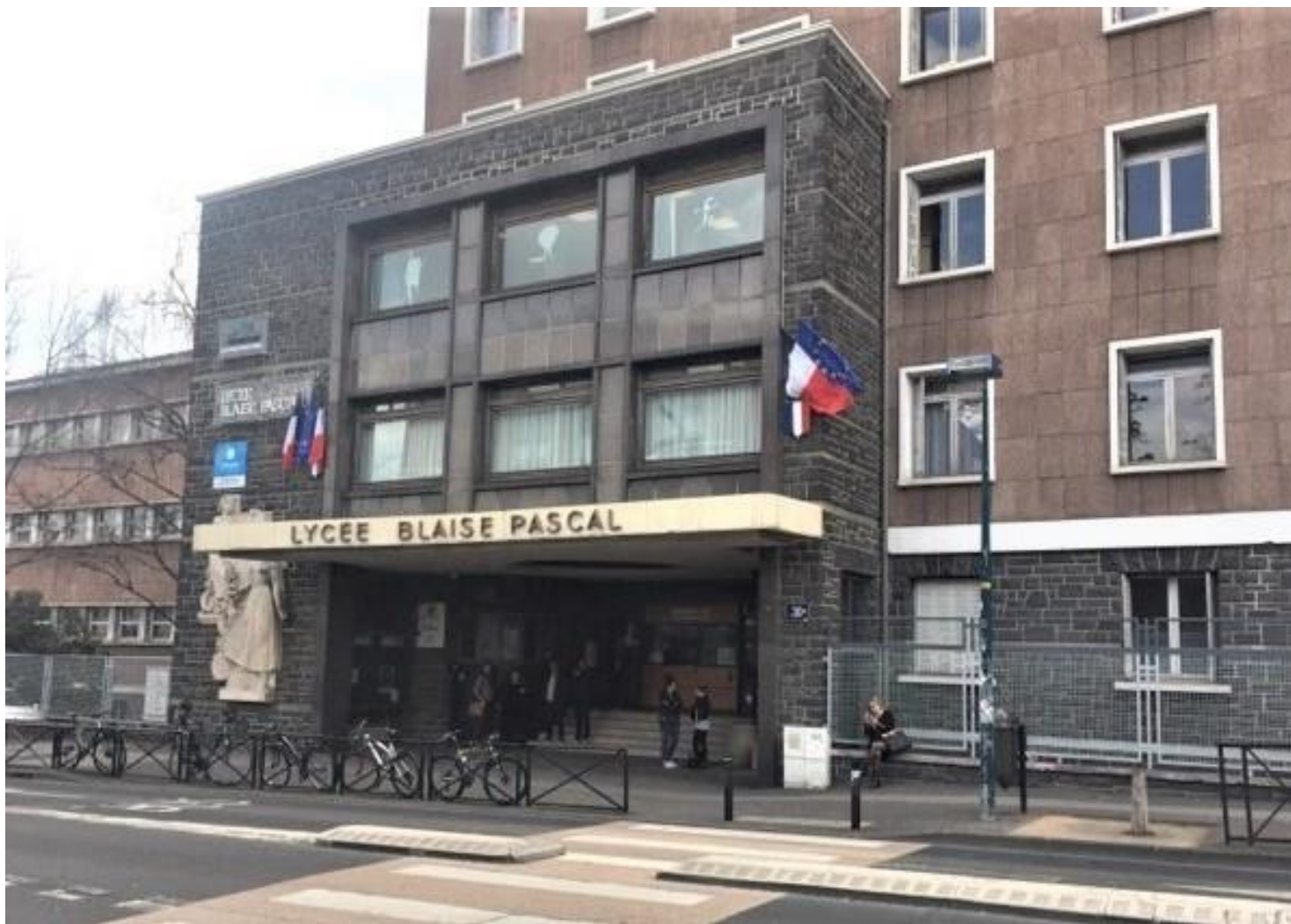
Lycée Blaise Pascal, Clermont-Ferrand (63)